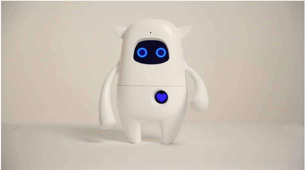
( AKA / Musio )