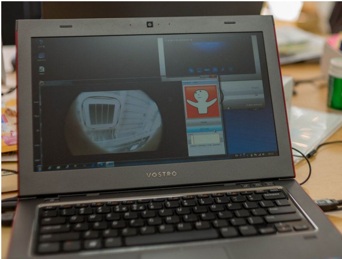
( telenoid planning, inc. / telenoid )