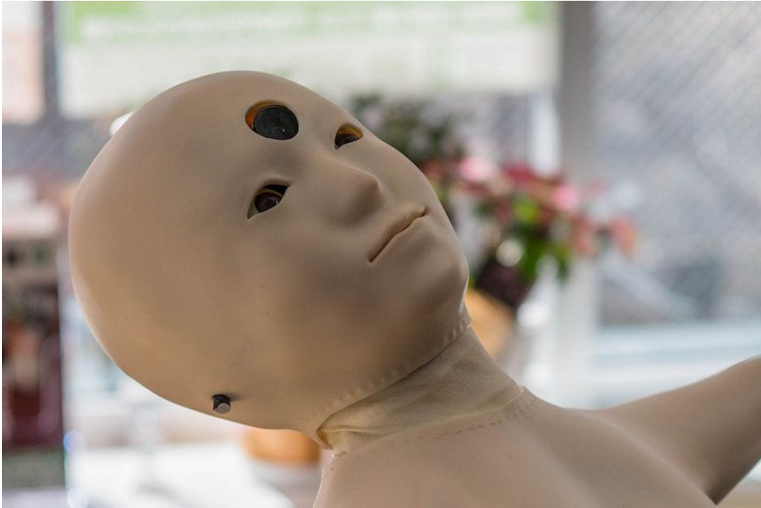
( telenoid planning, inc. / telenoid )