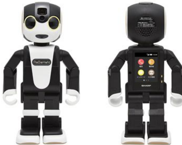
( Sharp Corporation / RoBoHoN )

モバイル通信(LTE/3G)に対応し、電話やメール、カメラなど携帯電話の基本機能や専用アプリケーションで提供される各種サービスを、『ロボホン』と対話しながら使用できます。新開発のフォーカスフリー小型レーザープロジェクターを搭載し、写真や動画、地図などを投影できるほか、専用アプリケーションをダウンロードすることで、利用できる機能やサービスを追加することができます。また、ユーザーの利用状況やプロフィールなどを『ロボホン』が学習・成長し、より自然なコミュニケーションが可能となります。